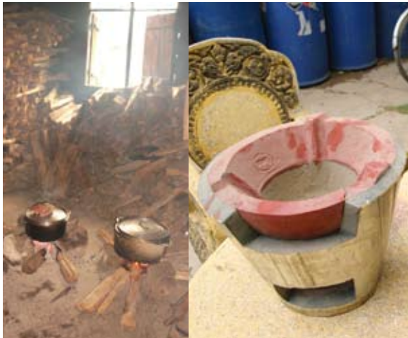
Verbesserte Lehmkocher (re.) lassen sich lokal produzieren und verringern den Holzverbrauch sowie die Rauchbelastung. li.: Traditionelle Kochstelle.

witzige Befragungen verordnen, aber es sollte dennoch klar sein, dass ein geschenkter Solarkocher eventuell nach der Abreise des Spenders nicht mehr verwendet wird, weil ihn niemand wollte und zudem nach lokaler Tradition abends gekocht wird. Dann verwendet man die Lamellen der Kocher doch lieber als Spiegel.